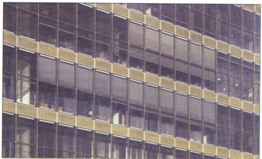
Prostoliniowa część fasady